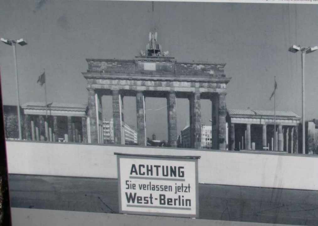
1978 Mauer am Brandenburger Tor The Wall at Brandenburg Gate