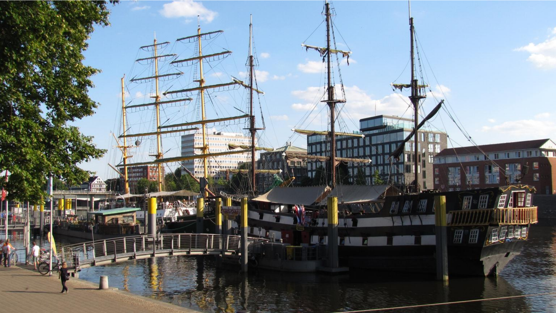
Ladje na reki Weser.