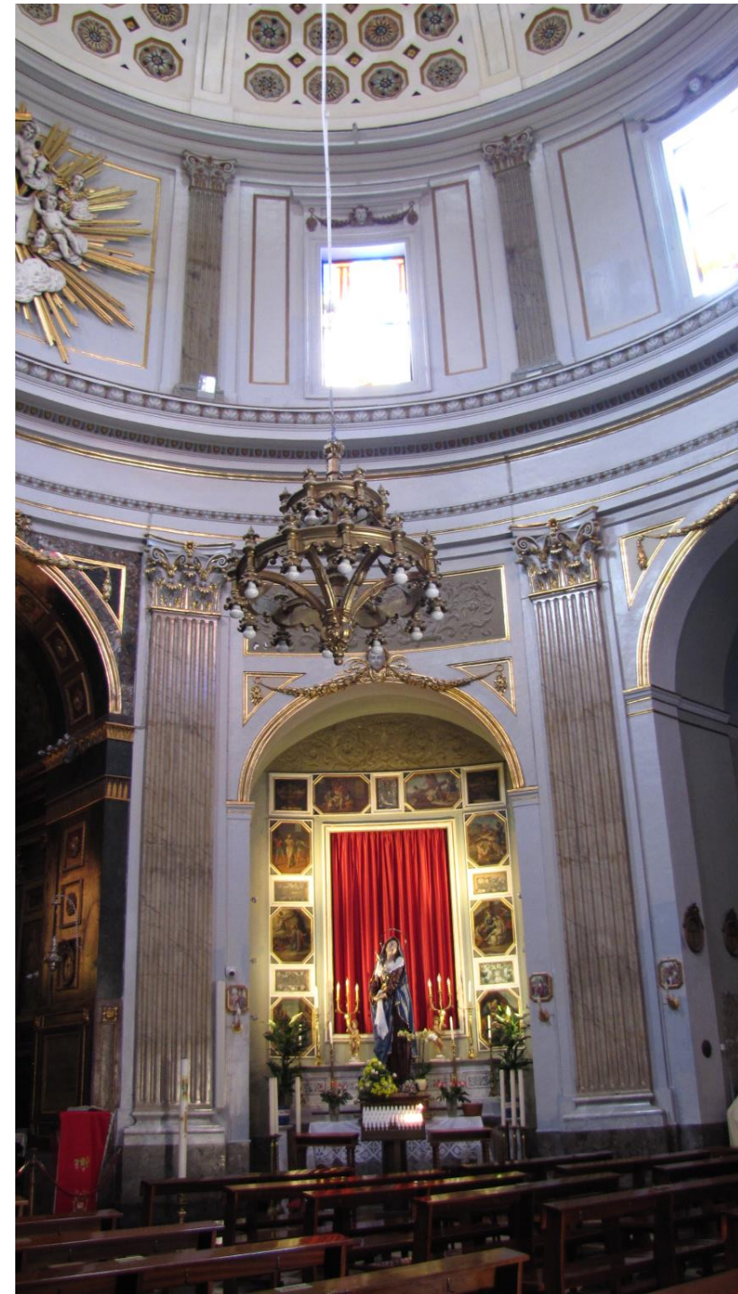
Vitraži pod kupolo poblíže.