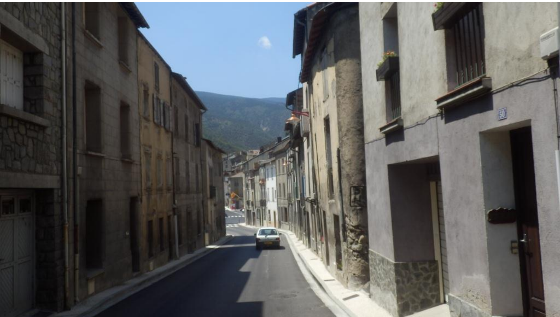
Evol v Franciji