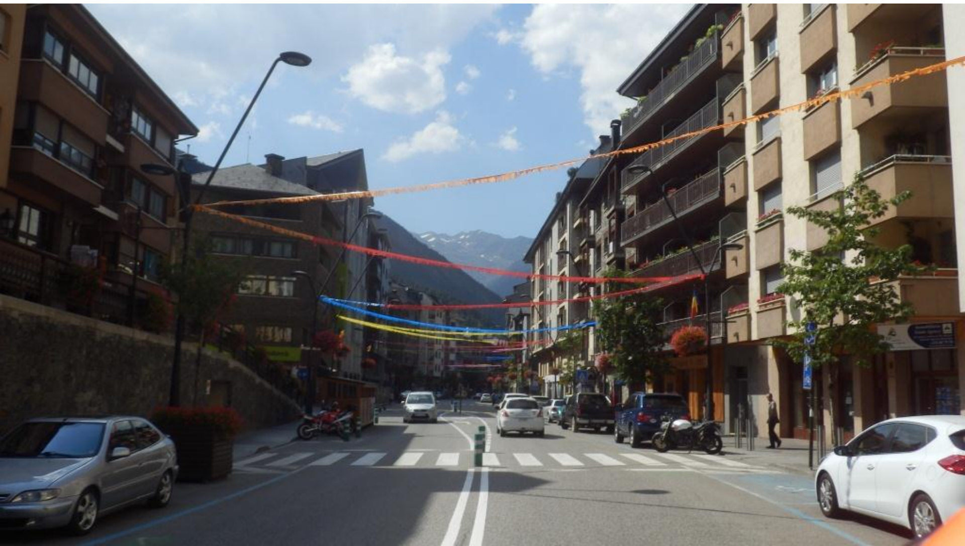
La Massana (pribl. 1300 m nad. višine) – najin kraj bivanja.