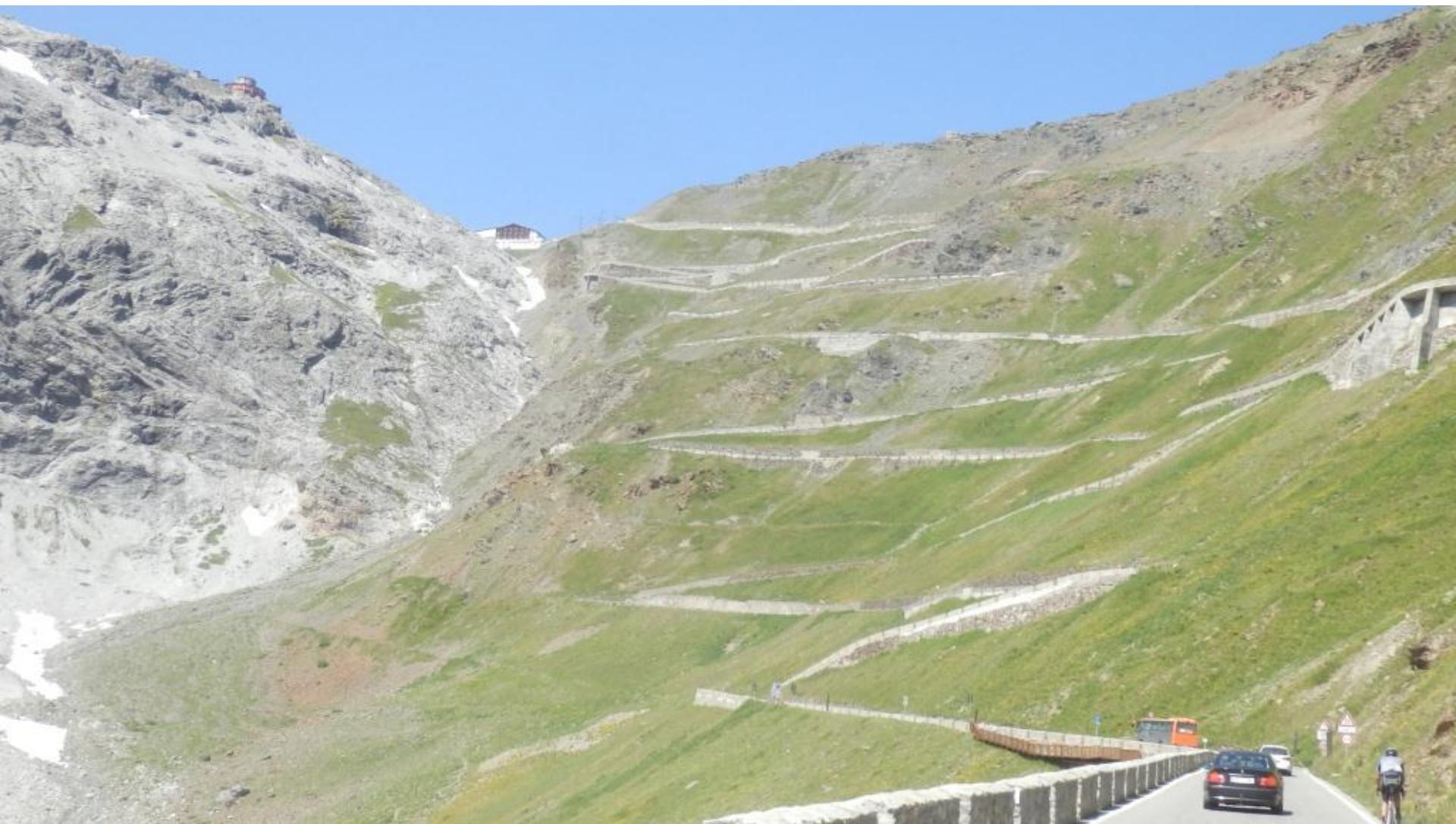
Pot na Stelvio (Italija), prelaz na višini 2760 metrov. Oblegajo ga tako kolesarji kot motoristi.