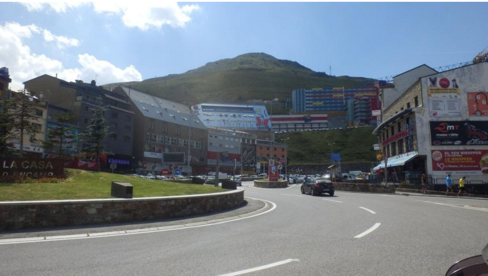
Pas de la Casa – prvi kraj po prečkanju meje. Tista lepa pisana zgradba na vrhu je parkirna hiša.