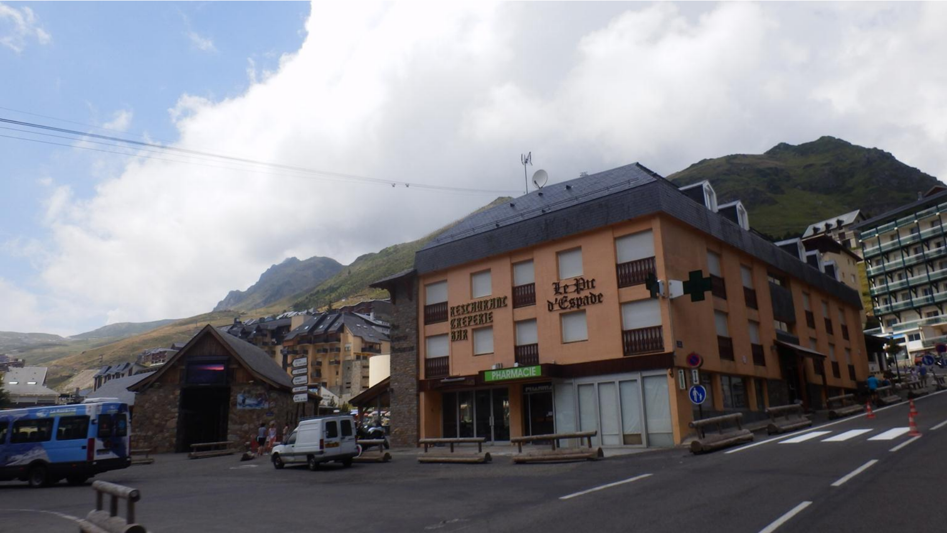
Na enem izmed prelazov. V francoščini so Col, v španščini pa Puerto.