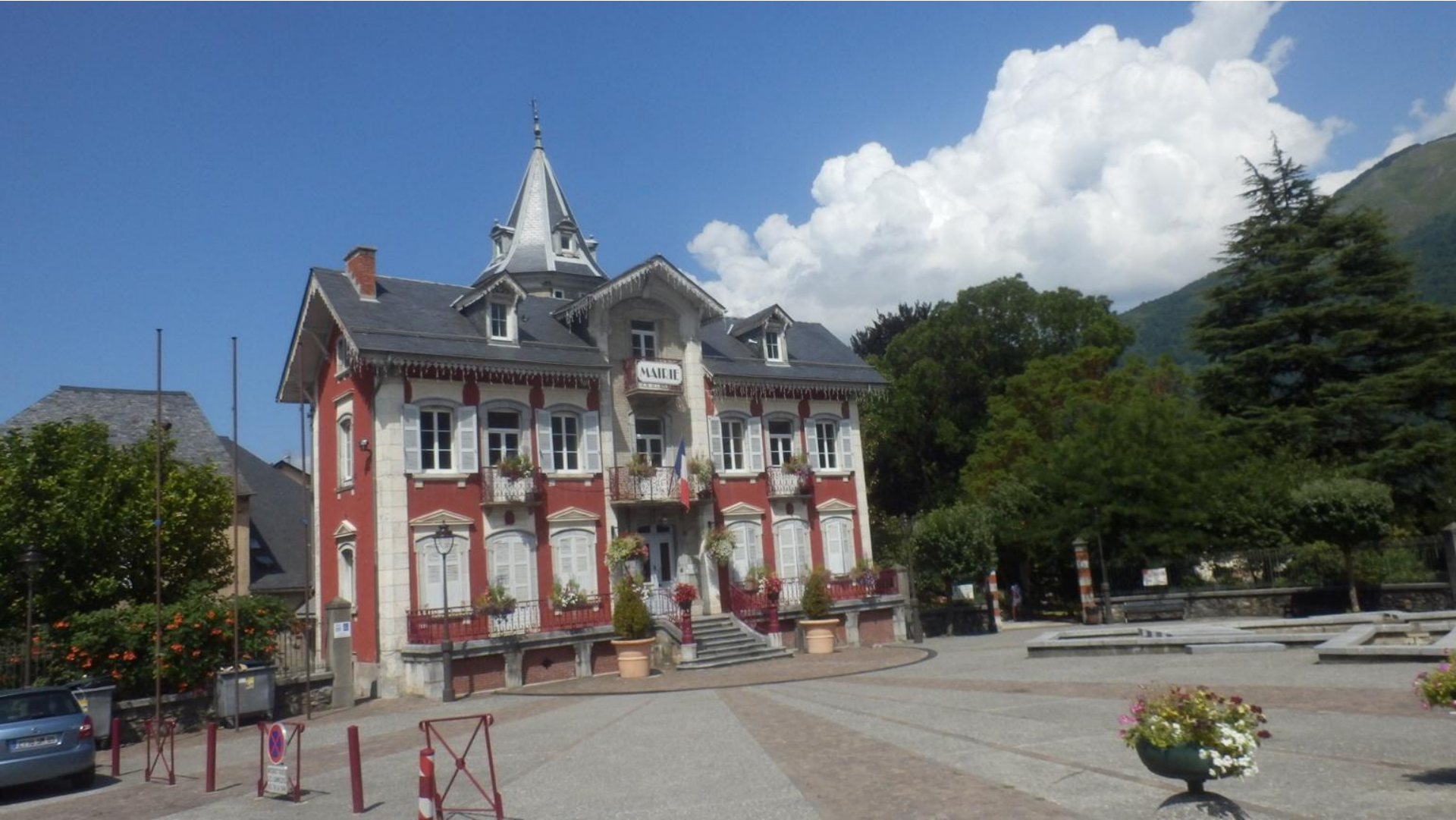
Mairie – kar bi prevedli kot županstvo ali mestna hiša.