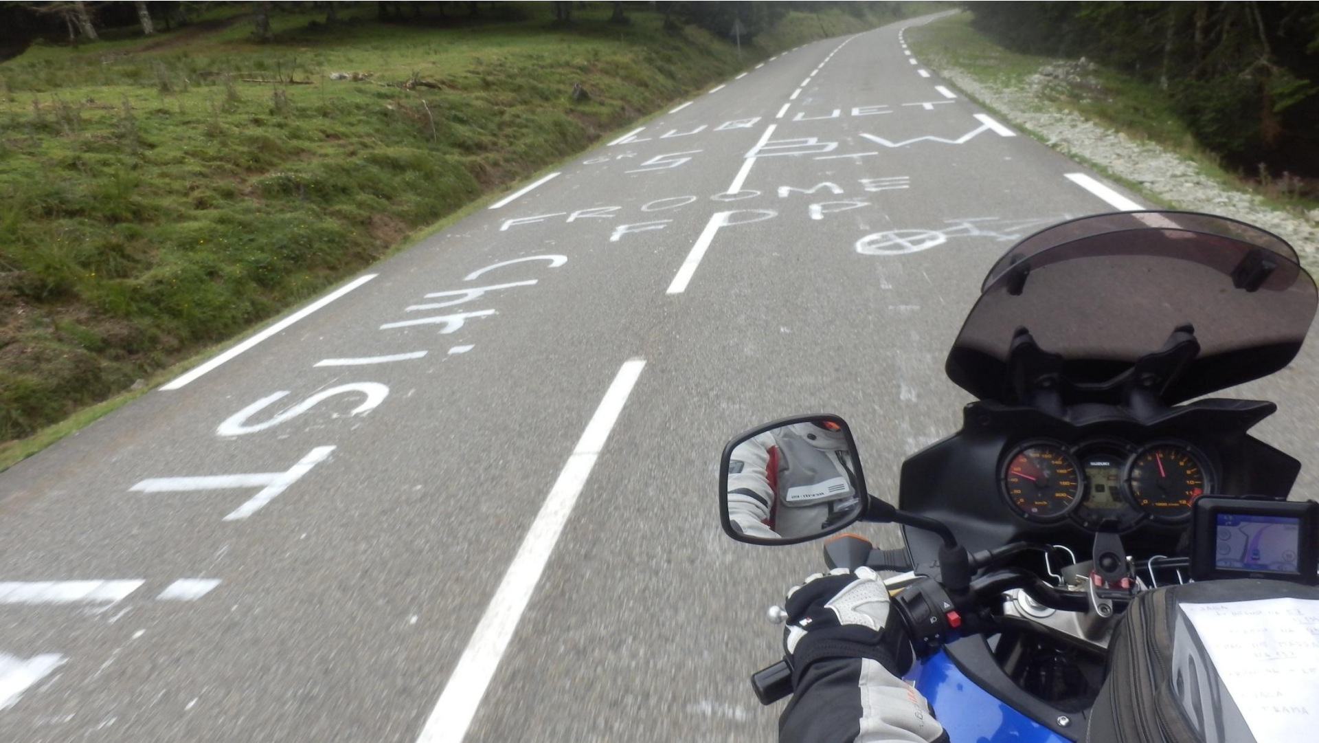
Tour de France