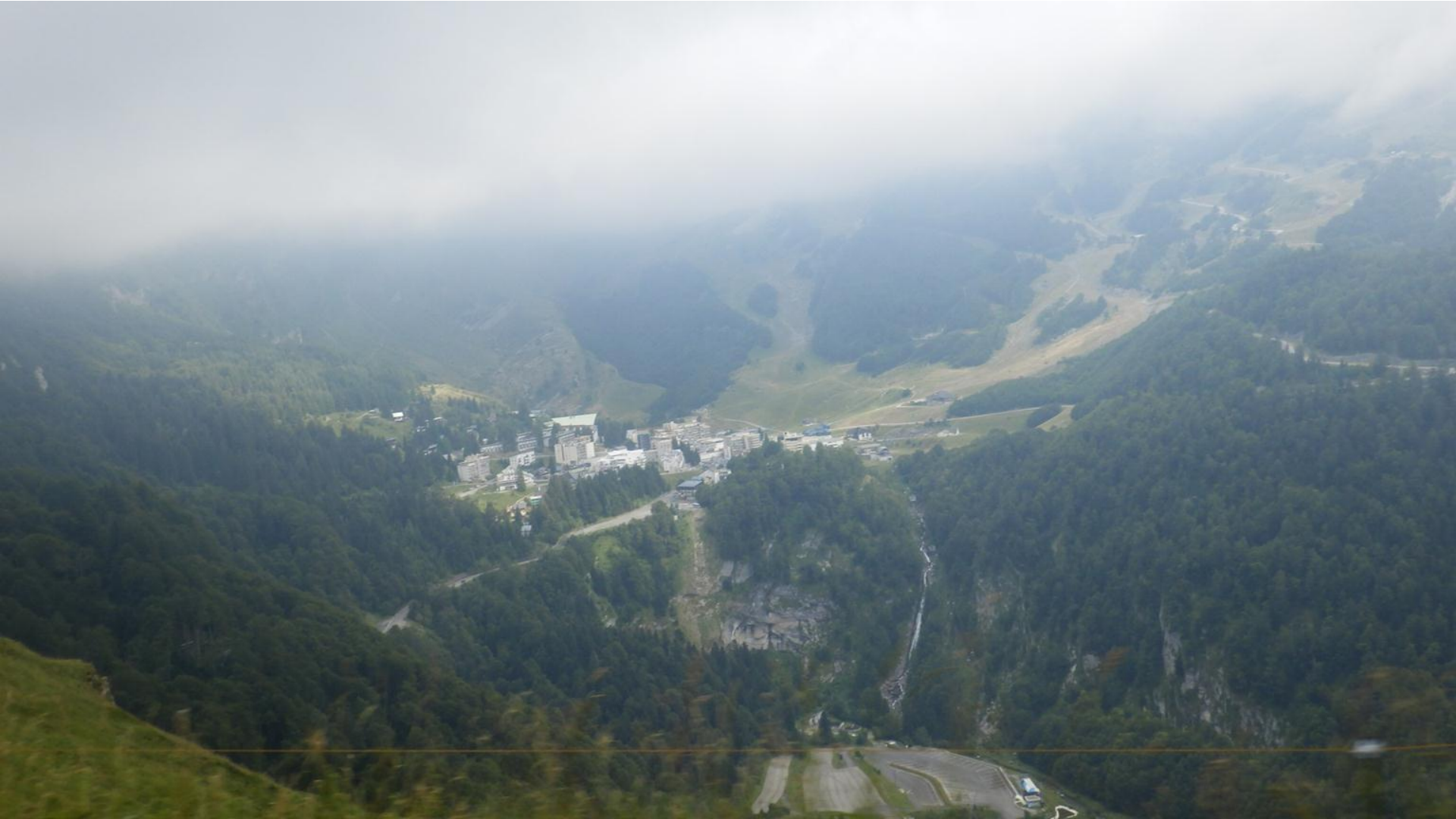
Pogled v dolino.